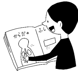
しりたい ことがある