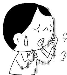
なやんでいる ことがある