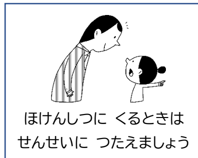
ほけんしつに くるときは せんせいに つたえましょう