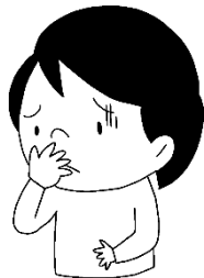
たいちょうが わるくなった