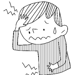
いたい ところがある