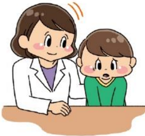
なや そうだん 悩みを相談する