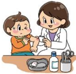
てあ けがの手当てをする