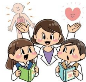
からだ こころ し 体や心について知る