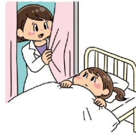
たいちょう わる やす 体調が悪いときに休む