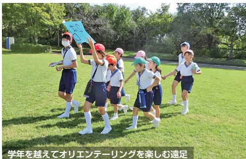
学年を越えてオリエンテーリングを楽しむ遠足