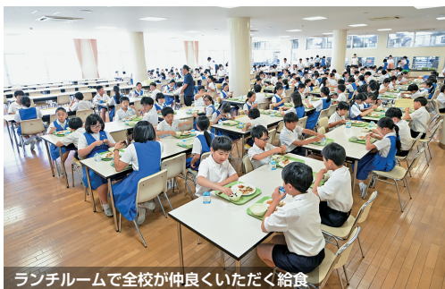
ランチルームで全校が仲良くいただく給食