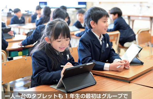
一人一台のタブレットも1年生の最初はグループで