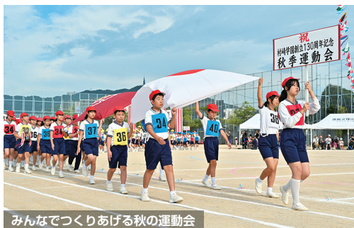
みんなでつくりあげる秋の運動会