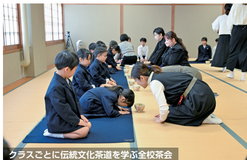
クラスごとに伝統文化茶道を学ぶ全校茶会