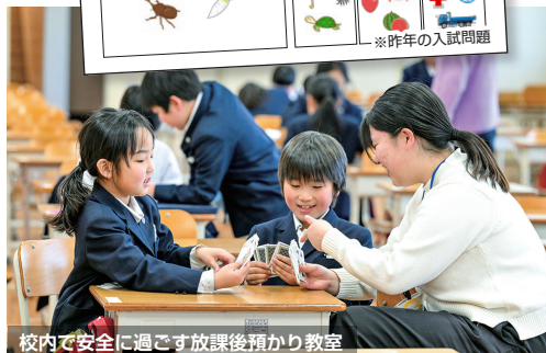
校内で安全に過ごす放課後預かり教室